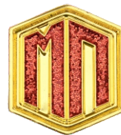
эмаль с блестками